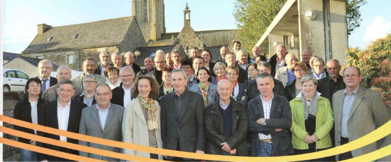
Conseil communautaire, élections 2014